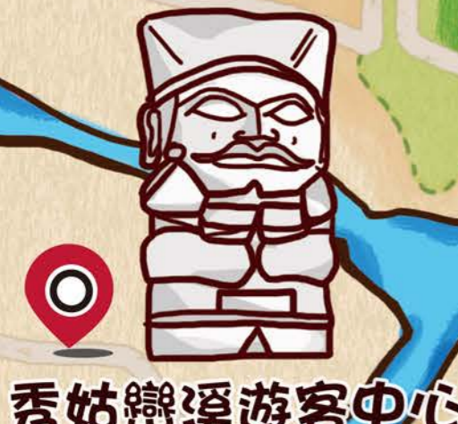
秀姑巒溪游客中心