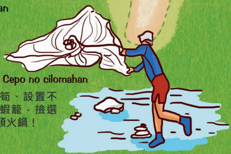
野炊處 Cepo no cilomahan 採集金多耳筍、設置不老魚陷阱及蝦籠，撿選麥飯石煮石頭火鍋！